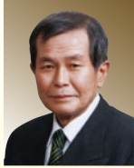
第64回 近畿北陸地区歯科医学大会会長 社団法人 兵庫県歯科医師会会長